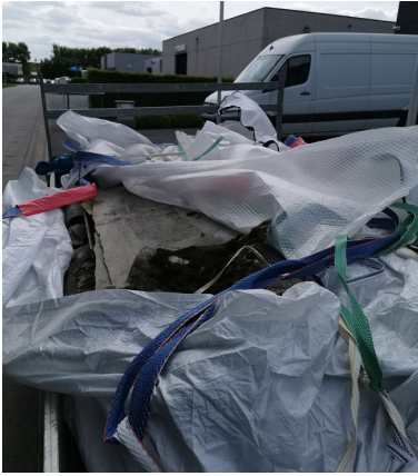
Zakken niet gesloten

Ter illustratie enkele foto's van niet-correcte aanbiedingen: